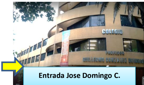
Entrada Jose Domingo C.

ORGANIZACIÓN INGRESO Y SALIDA POR CURSO (horario)