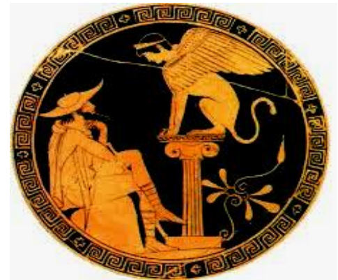
Edipo en el momento de resolver el enigma que le propone la esfinge, el monstruo que esperaba a los viajeros en las afueras de Tebas.

El objetivo último de una tragedia es provocar en los espectadores dos emociones: el temor y la compasión. Bajo los principios por los que se regía, se daba por supuesto que al ver al personaje heroico sometido a variadas desgracias que le ocurrían, el público iba a comprender cuán inevitable era el destino, es decir, la voluntad de los dioses con respecto a la vida de estos personajes mortales. Al lograr comprenderlo, los espectadores podían entender su propia condición mortal y someterse a los designios divinos. Así se producía el proceso conocido como catarsis (purificación del espíritu a través del dolor).