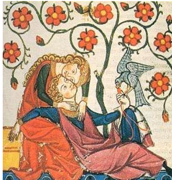
"Tragicomedia de Calixto y Melibea", de Fernando de Rojas, también conocida como "La Celestina"

En la época moderna, hay una preeminencia de los temas sociales dadas las nuevas condiciones impuestas por la industrialización. En la época contemporánea, en cambio, se incorporan otros temas que apuntan, más allá de la contingencia, a la condición del ser humano y a sus conflictos existenciales. Son temas contemporáneos: la soledad, el absurdo, la crueldad, la violencia, la angustia y la alienación.