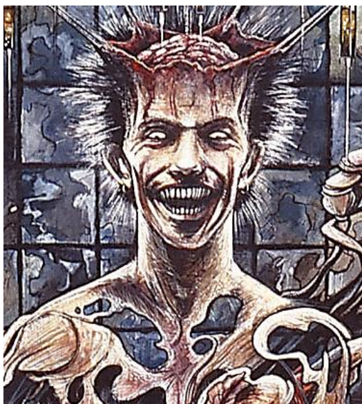
Ilustración original para los Libros de sangre de Clive Barker

Comienza el período del terror contemporáneo. A principios de la década de los ochenta Stephen King ya había escrito varias obras importantes, pero con IT se consolida como el «Rey del Terror» que reinará sobre por lo menos una década. El gore y la transgresión de Clive Barker o Chuck Palahniuk, la sutileza de Thomas Ligotti y la crueldad de Dan Simmons; todo se vuelve más brutal, King pierde el trono después de un largo declive y su hijo Joe Hill entra pisando fuerte aspirando quizás a heredar la corona de su padre.