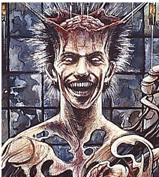
Ilustración original para los Libros de sangre de Clive Barker

Comienza el período del terror contemporáneo. A principios de la década de los ochenta Stephen King ya había escrito varias obras importantes, pero con IT se consolida como el «Rey del Terror» que reinará sobre por lo menos una década. El gore y la transgresión de Clive Barker o Chuck Palahniuk, la sutileza de Thomas Ligotti y la crueldad de Dan Simmons; todo se vuelve más brutal, King pierde el trono después de un largo declive y su hijo Joe Hill entra pisando fuerte aspirando quizás a heredar la corona de su padre.