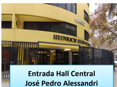
Entrada Hall Central José Pedro Alessandri