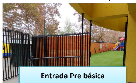
Entrada Pre básica